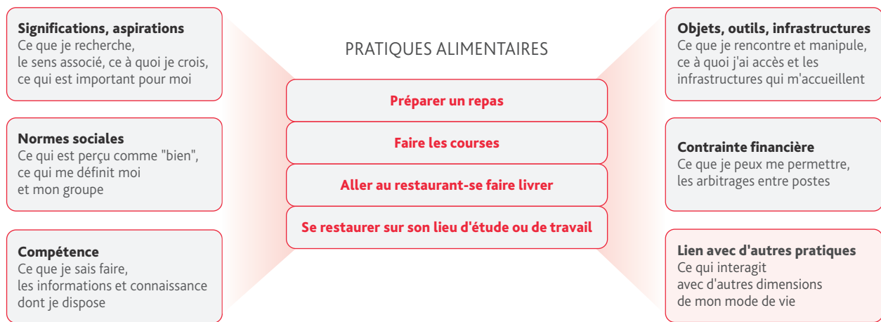
FIGURE 2. L'alimentation peut être décomposée en quatre pratiques concrètes, représentées via six composantes

L'alimentation est un ensemble de pratiques concrètes, attachées à des individus ou ménages, partagées au sein de groupes. Une pratique combine plusieurs éléments en interactions: c'est un ensemble d'aspirations, de capacité et de contraintes. C'est d'ailleurs pour cela qu'elle ne change pas si facilement.